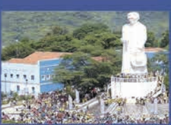
REGIAO DO CARIRI