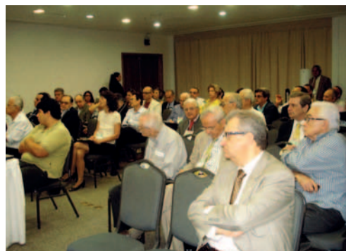
Um seletivo público prestigiou a XIV Biental da Academia Cearense de Medicina