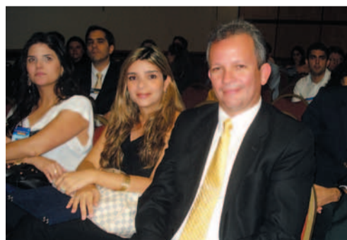
Deputado Federal André Figueirêdo