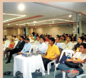
Audatório com plateia atenta e participativa. Motivação: Responsabilidade Civil, Ética e Trabalhista. CBHPM.