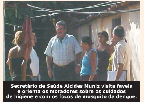
Secretário de Saúde Alcides Muniz visita favela e orienta os moradores sobre os cuidados de higiene e com os focos de mosquito da dengue.