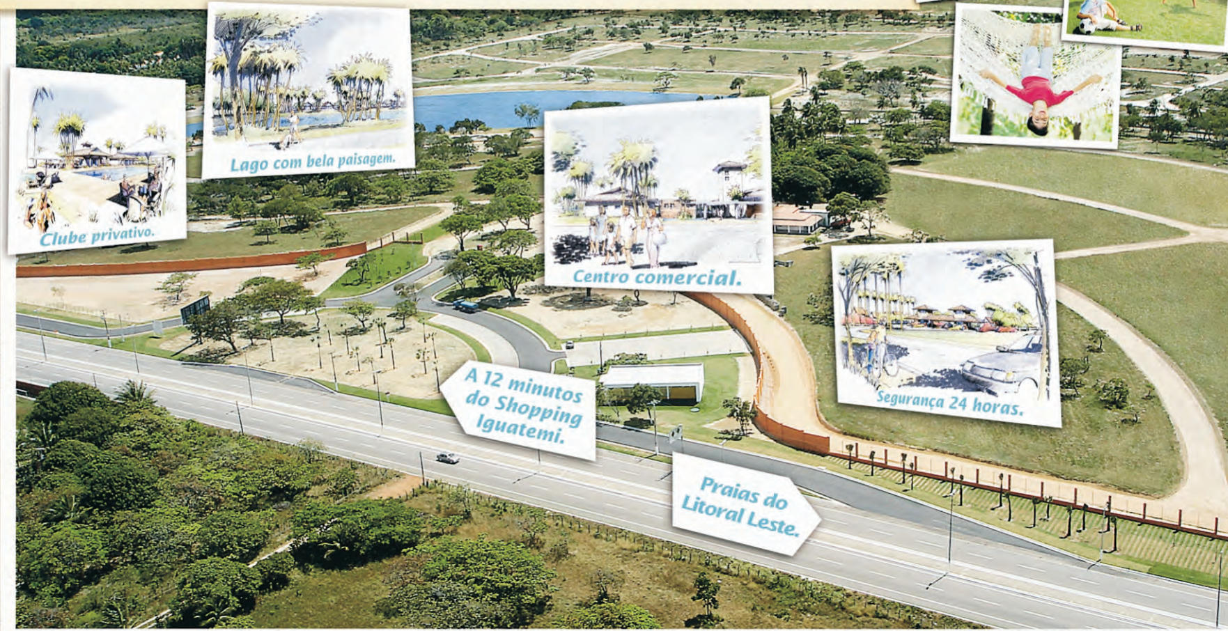
Foto do empreendimento - agosto/2005.

Loteamento AlphaVille Eusébio - registrado no R. 02, matrícula nº 3294 - Cartório do 2º Ofício de Registro de Imóveis de Eusébio - CE. *Valor referente à quadra B1, lote 05, de 450,29 m 2 . Entrada de R$ 16.683,24 e 72 parcelas de R$ 1.283,45.