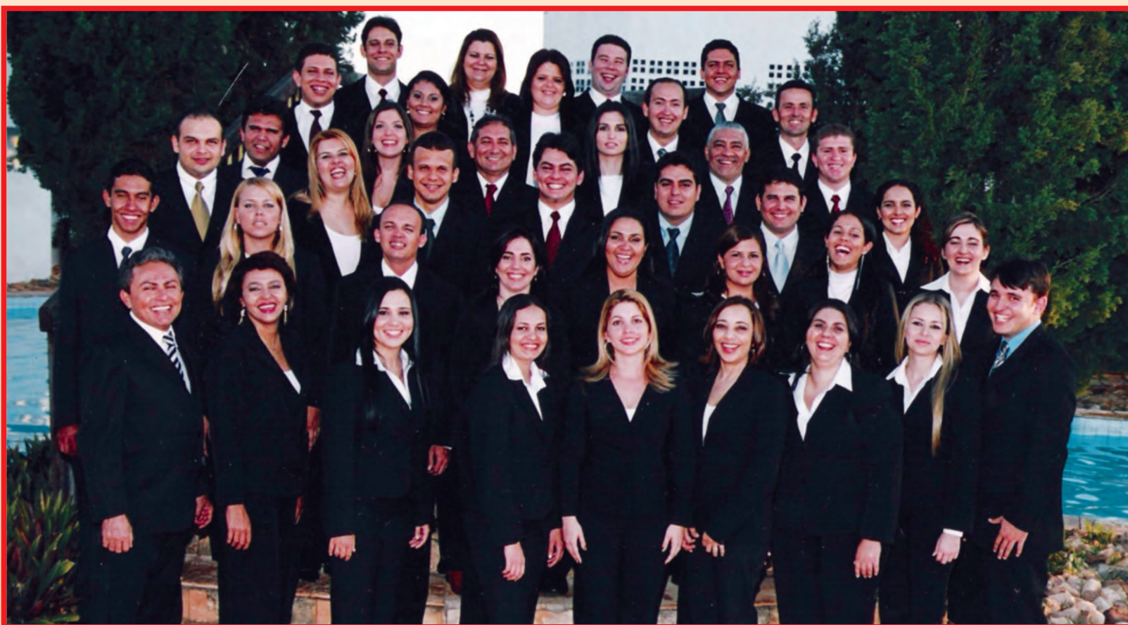
Colação Faculdade Leão Sampaio

10 cursos de Pós-graduação nas diversas áreas, atualmente com mais de 3500, está estabelecida em 02 Campus universitários e vem contribuindo de forma decisiva no desenvolvimento do Cariri, comprometida com o progresso e a formação da juventude caririense, ela firmou-se definitivamente como Sinônimo de qualidade de ensino Superior para todos os segmentos sociais.