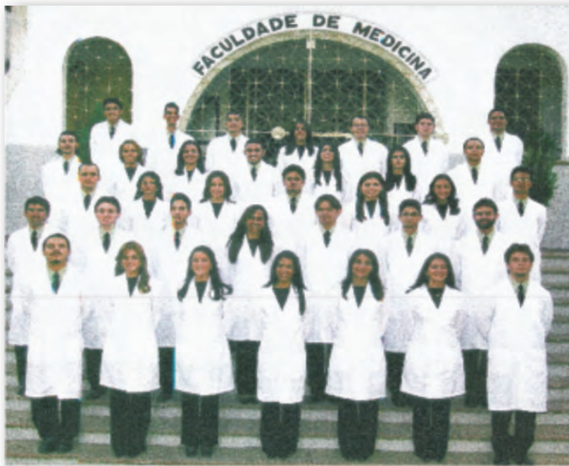
Formandos da Faculdade de Medicina de Barbalha