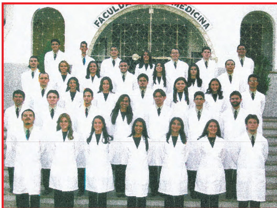
Formandos UFCe Barbalha

Houve um somatório de espírito público das nossas lideranças e autoridades de todos os níveis, cujo coroamento foi a formatura da primeira