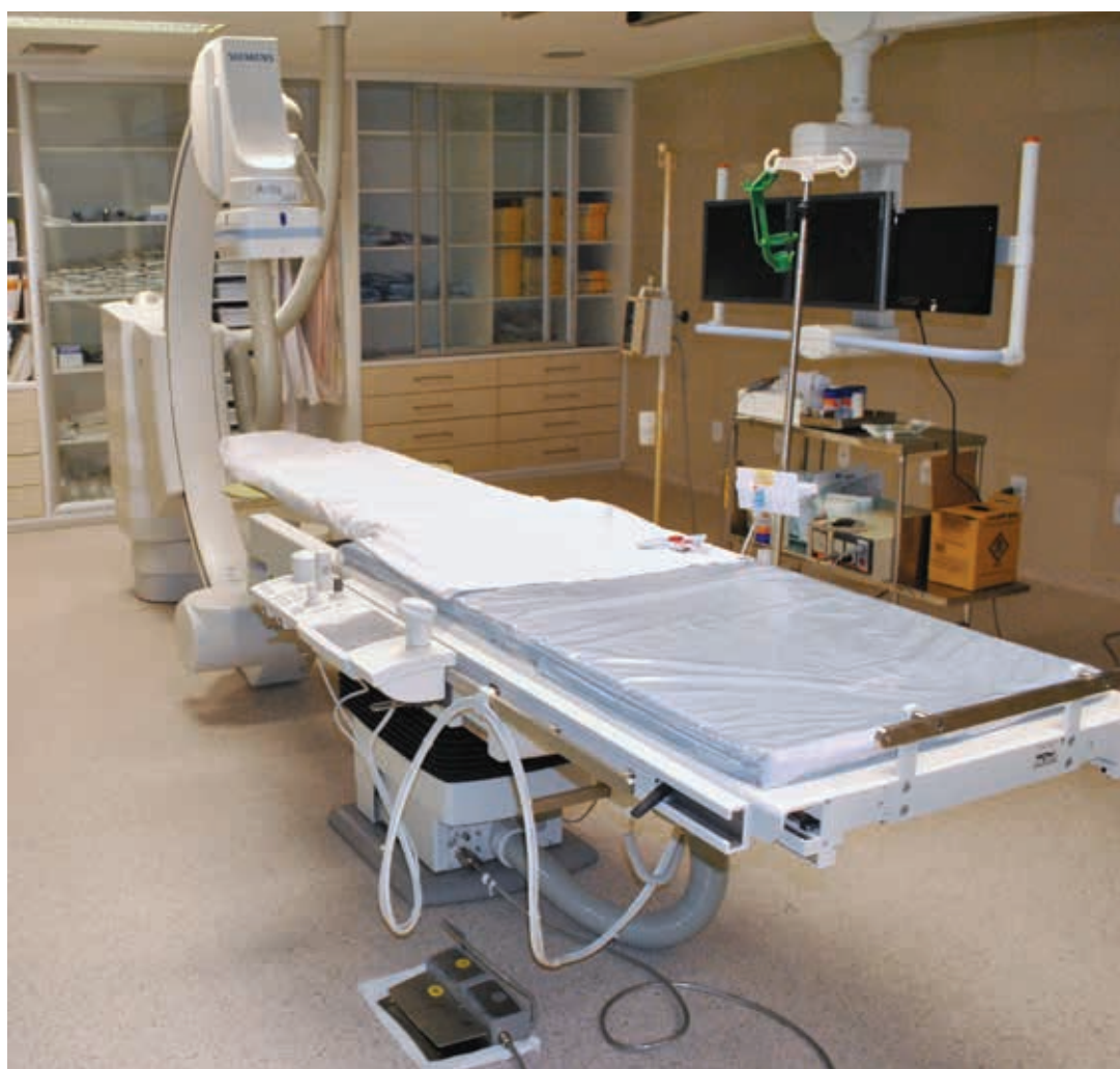
Nova Sala de Cateterismo Cardíaco

Atualmente, o Hospital do Coração realiza cerca de 250 atendimentos ambulatoriais diários, 70 atendimentos diários no pronto atendimento, 25 cirurgias cardíacas mensais, 90 angioplastias coronarianas mensais, 200 internações mensais em UTI e 150 internamentos mensais