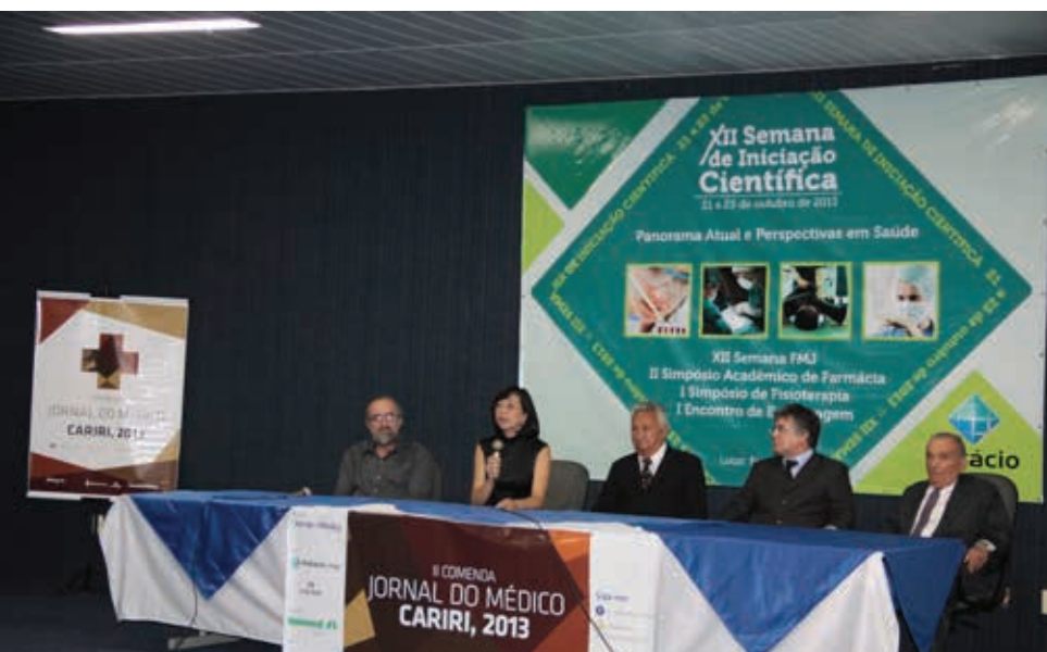
Mesa diretora da II Comenda Jornal do Médico, Dia do Médico 2013 realizado na Faculdade de Medicina Estácio-FMJ em Juazeiro do Norte-CE