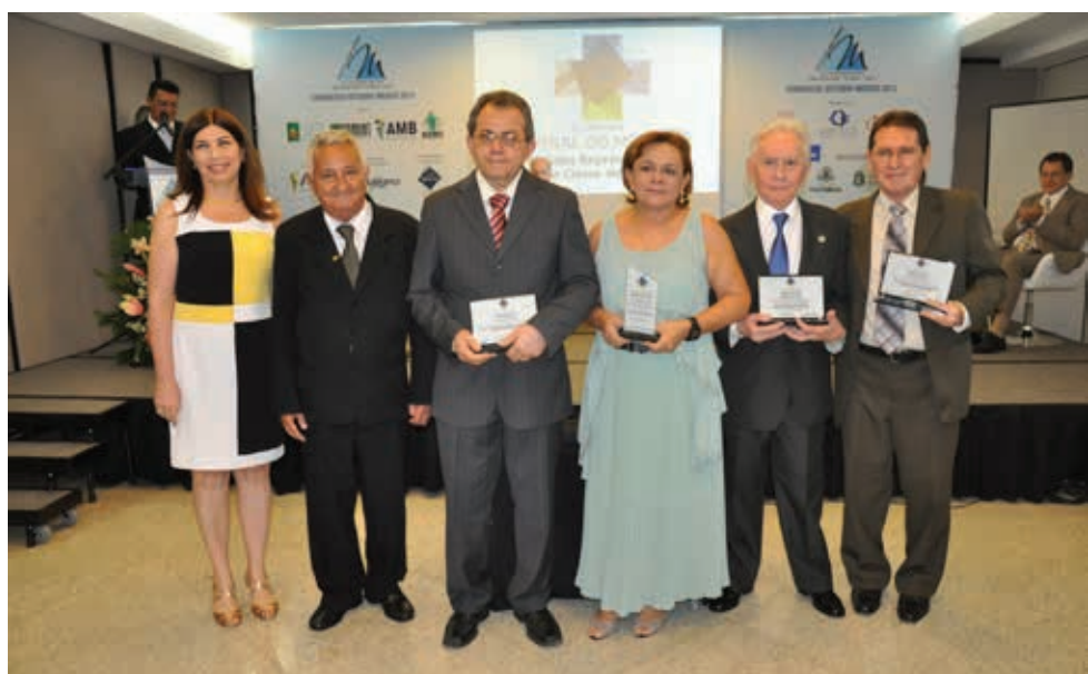
Homenageados com II Comenda Jornal do Médico, Dia do Médico 2013 realizado em parceria com a AMC - Associação Médica Cearense durante abertura do XXVII Congresso Outubro Médico em Fortaleza-CE

Contando com o apoio de diversas entidades, com CREMEC,