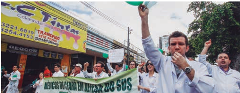
Manifestações organizadas pelo SIMEC pelas ruas de Fortaleza-CE

- Foram centenas de ações vencidas pelo Departamento Jurídico do SIMEC, em defesa dos médicos, na justiça do trabalho e/ou no CREMEC, e várias outras continuam em trami-