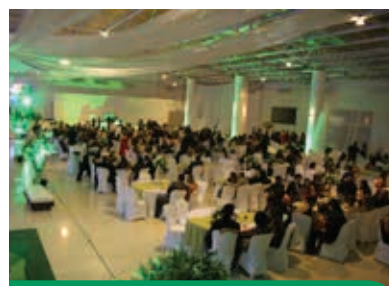
Um grande e seletto público prestigiaram o Baile dos 30 anos

e banindo do nosso meio toda postura extrativista ou espoliativa. Andemos unidos, pois juntos somos mais fortes”.