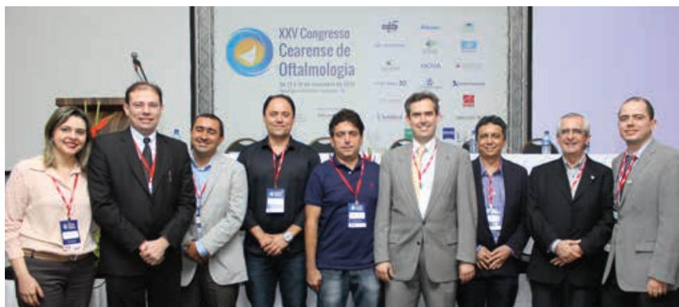
Membros da nova diretoria da Sociedade Cearense de Oftalmologia, SCO

Com 240 inscritos, o evento trouxe, durante os três dias de atividades, inúmeros debates através