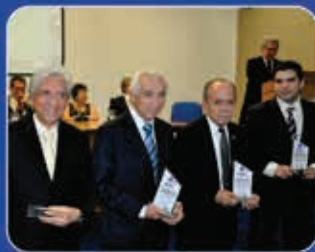
3ª edição Fortaleza-CE Reitoria UFC 17.out.14