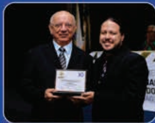
3ª edição Região do Cariri Estácio-FMJ 23.out.14