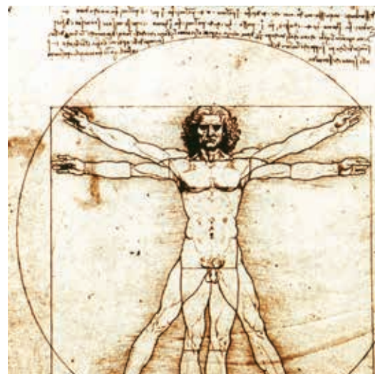
HOMEM VITRUVIANO (1490) LEONARDO DA VINCI (1452-1519) LÁPIS E TINTA SOBRE PAPEL - 34CMX24CM

Leonardo di Ser Piero da Vinci nasceu no dia 15 de abril de 1452, em Anchiano - Itália e faleceu no dia 2