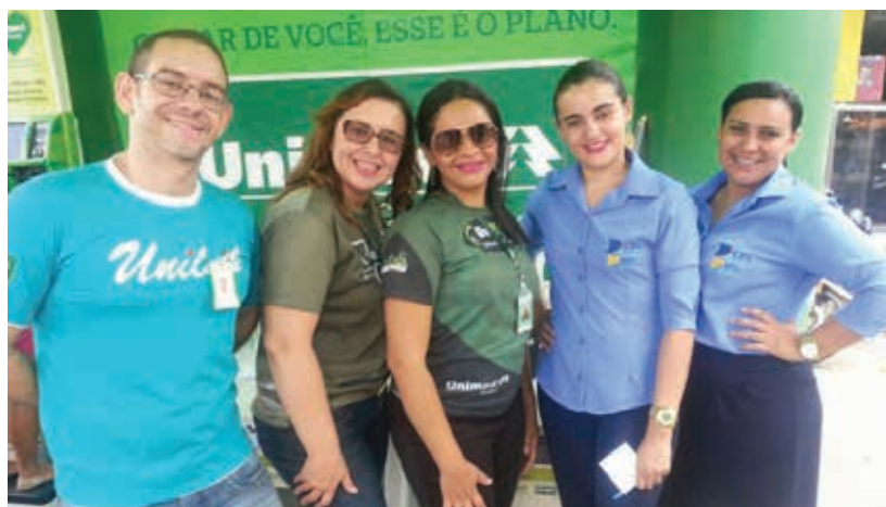
UNIMED E EQUIPE CDL

O evento de lançamento da parceria foi aberto ao público e ocorreu na principal rua da cidade de Acopiara, aproveitando o encerramento da campanha do mês das mães, promovido pela CDL. Durante a solenidade, houve a reali-