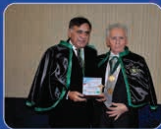
1ª edição Fortaleza-CE Reitoria UFC 26.out.12

Comenda Jornal do Médico, Dia do Médico reconhecendo e valorizando a Medicina & Saúde Cearense.