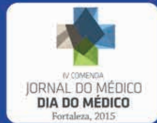
4ª edição Fortaleza-CE XXVIII Outubro Médico 15.out.15