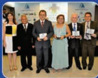
2ª edição Fortaleza-CE XXVII Outubro Médico 16.out.13