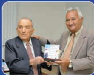
1ª edição Região do Cariri Unimed Cariri 17.out.12