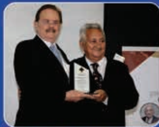
2ª edição Região do Cariri Estácio-FMJ 24.out.13