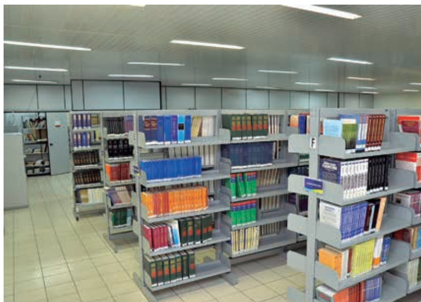
Biblioteca climatizada e com grande acervo

cumprimento de sua responsabilidade social; oferecer condições para a especialização e o aperfeiçoamento de seu corpo docente, discente, técnico-administrativo e profissionais de saúde da região.