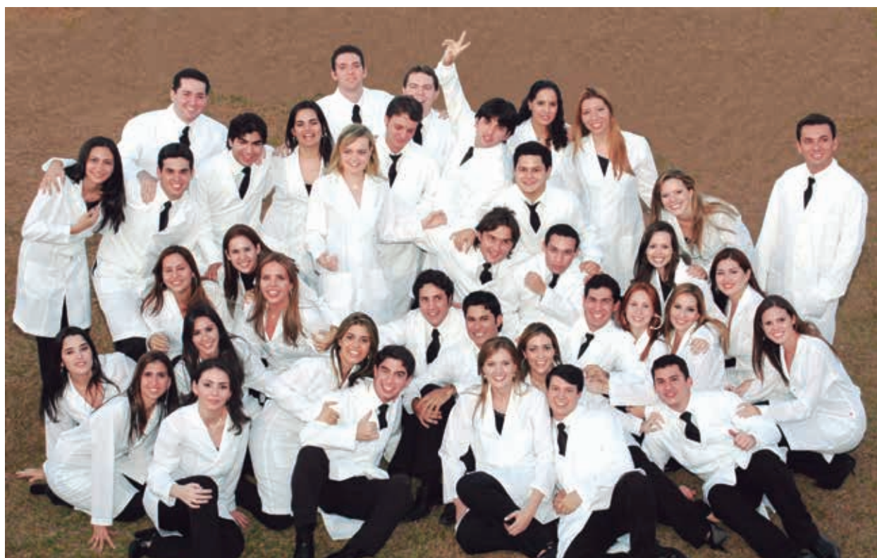
Primeira turma de medicina Estácio-FMJ "Pioneirismo, Fé e Coragem"

A INSTITUIÇÃO, PIONEIRA NO ENSINO SUPERIOR PARTICULAR DE MEDICINA NO ESTADO DO CEARÁ, COMPLETA 15 ANOS DE SUCESSO E RECONHECIMENTO