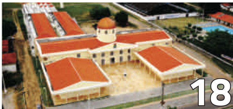
FAMED UFC SOBRAL 15 ANOS Um grande marco no ensino médico