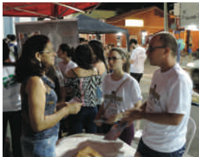
Alunos FAMED UFC Campus Sobral

As competências delimitadas são desenvolvidas nos estudantes por meio de técnicas adequadas a cada um desses três domínios, com enfoque nas metodologias ativas de aprendizagem. As competências são operacionalizadas em desempenhos que são certificados por meio de modernas técnicas de avaliação da