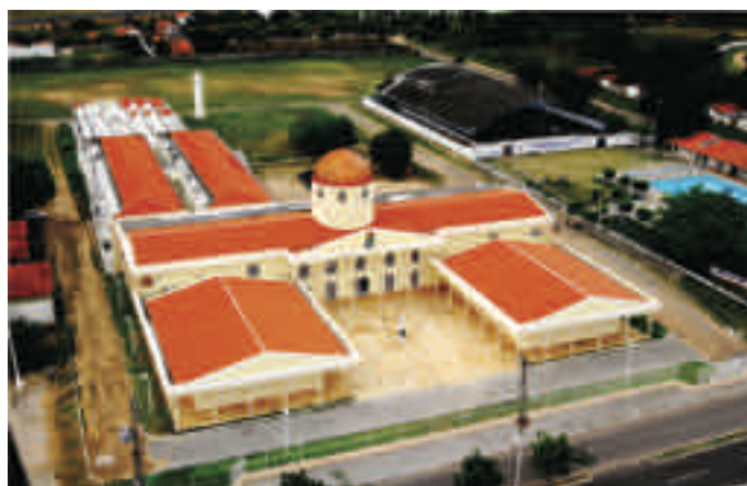
foto área do Campus Medicina

Nesse contexto, os avanços teórico-metodológicos em Educação Médica precisam ser devidamente incorporados nas escolas médicas. Com efeito, nos últimos anos, grupos específicos de docentes de diversas escolas em vários países do mundo, incluindo, mais recentemente, o Brasil, têm se interessado em estudar o tema, bem como