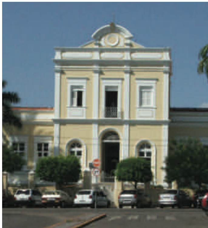
Fachada Santa Casa de Sobral

Durante todos estes anos novos serviços foram e continuam sendo incorporados: Hospital Regional Norte; Hospital Dr. Estevam; Hospital do Coração; Policlínica Estadual; Centro de Especialidades Médicas, CAPS- Centro de Apoio Psicossocial, CSF-Centros de Saúde da Família e Centro de Infectologia do município de Sobral; INSS- Instituto Nacional de Seguridade Social; além ainda alguns