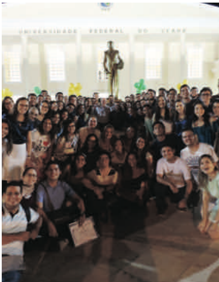
VI SARAU DO VISCONDE

O SERTÃO VAI VIRAR MAR Pós-Graduação Stricto Sensu da UFC no interior todo Estado do Ceará