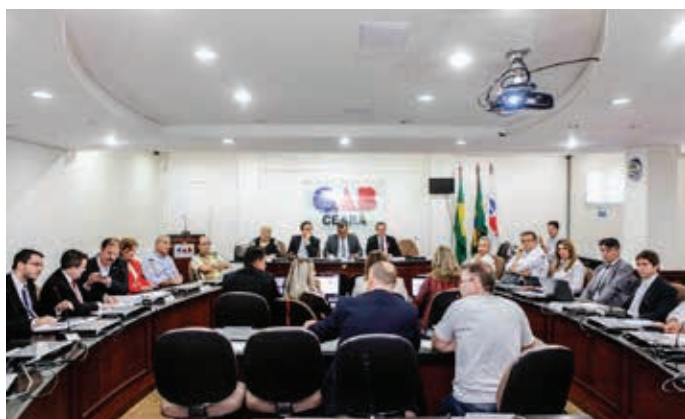
AUDIÊNCIA PÚBLICA NA OAB (SCO BLOQUEIA INSERÇÃO DA OPTOMETRIA NO SUS DO ESTADO).