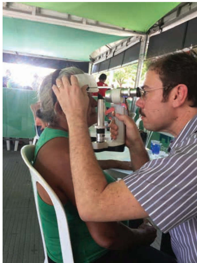
INSERÇÃO DA LÂMPADA DE FENDA PORTÁTIL NOS PROJETOS SOCIAIS DA SCO.

O exame oftalmológico completo, com medida da acuidade visual, tonometria (medida da pressão intraocular), refração, biomicroscopia e exame fundoscópico, só é possível em consultório, com iluminação e aparelhagem adequada e só pode ser