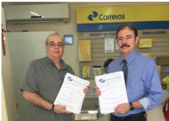
ENTREGANDO ENVELOPES NO CORREIOS COM INSTRUÇÕES PARA VIGILÂNCIAS SANITÁRIA DE TODOS OS MUNICÍPIOS DO ESTADO E PARA TODOS OS PROMOTORES.